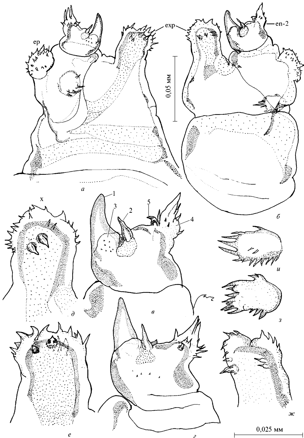
Рис. 2. Антенна II самки Salmincola mica , ♀: а, б — общий вид, латерально (en2 — дистальный членок эндоподита; ep — подушечка базального членка эндоподита с шипиками; exp — экзоподит; sp — подушечка симподита с шипиками); в, г — дистальный членок эндоподита, латерально (1—5 — структуры); д—ж — экзоподит, латерально (x — сосочек); з, и — подушечка симподита с шипиками.

Fig. 2. Second antenna of Salmincola mica , ♀: а, б — entire, lateral (en2 — distal segment of endopod; ep — spiny pad of basal segment of endopod; exp — exopod; sp — spiny pad of sympod); в, г — tip of endopod, lateral (1—5 — armature of the segment); д—ж — exopod, lateral (x — papilla); з, и — spiny pad of sympod.